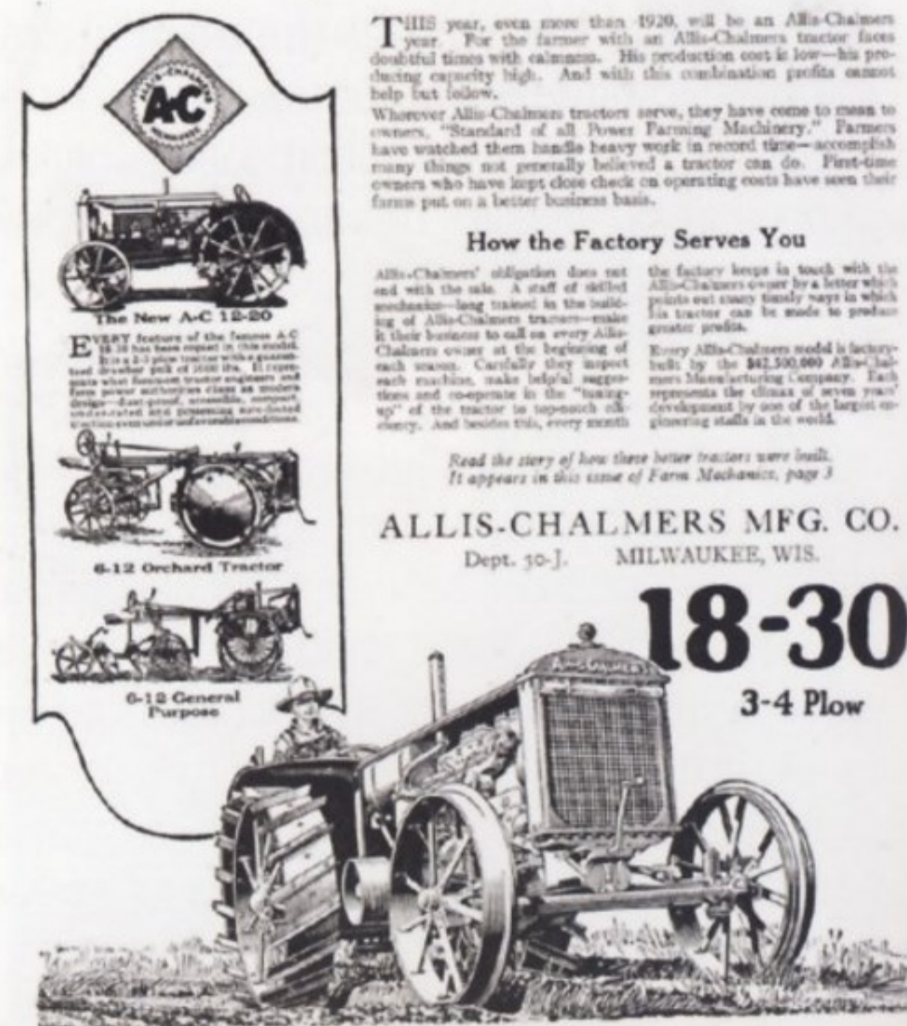
Реклама трактора Allis-Chalmers.

наиболее популярным становится трактор 20/35, развивающий мощность до 45 л. с. благодаря четырехцилиндровому двигателю объемом 7,6 л.