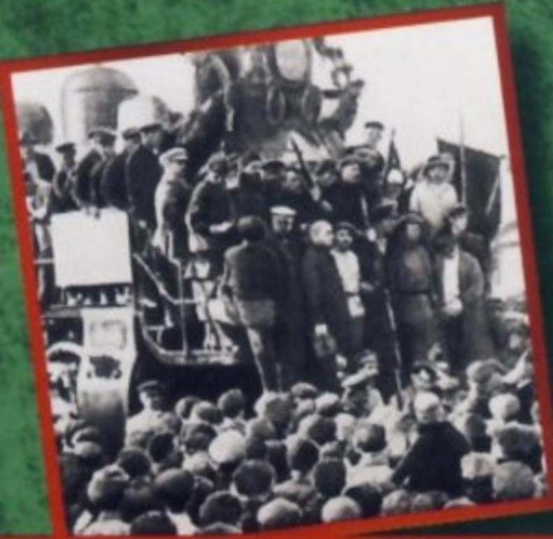
Двигатели в России 1920-х годов