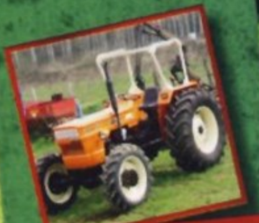
Итальянские тракторы Fiat