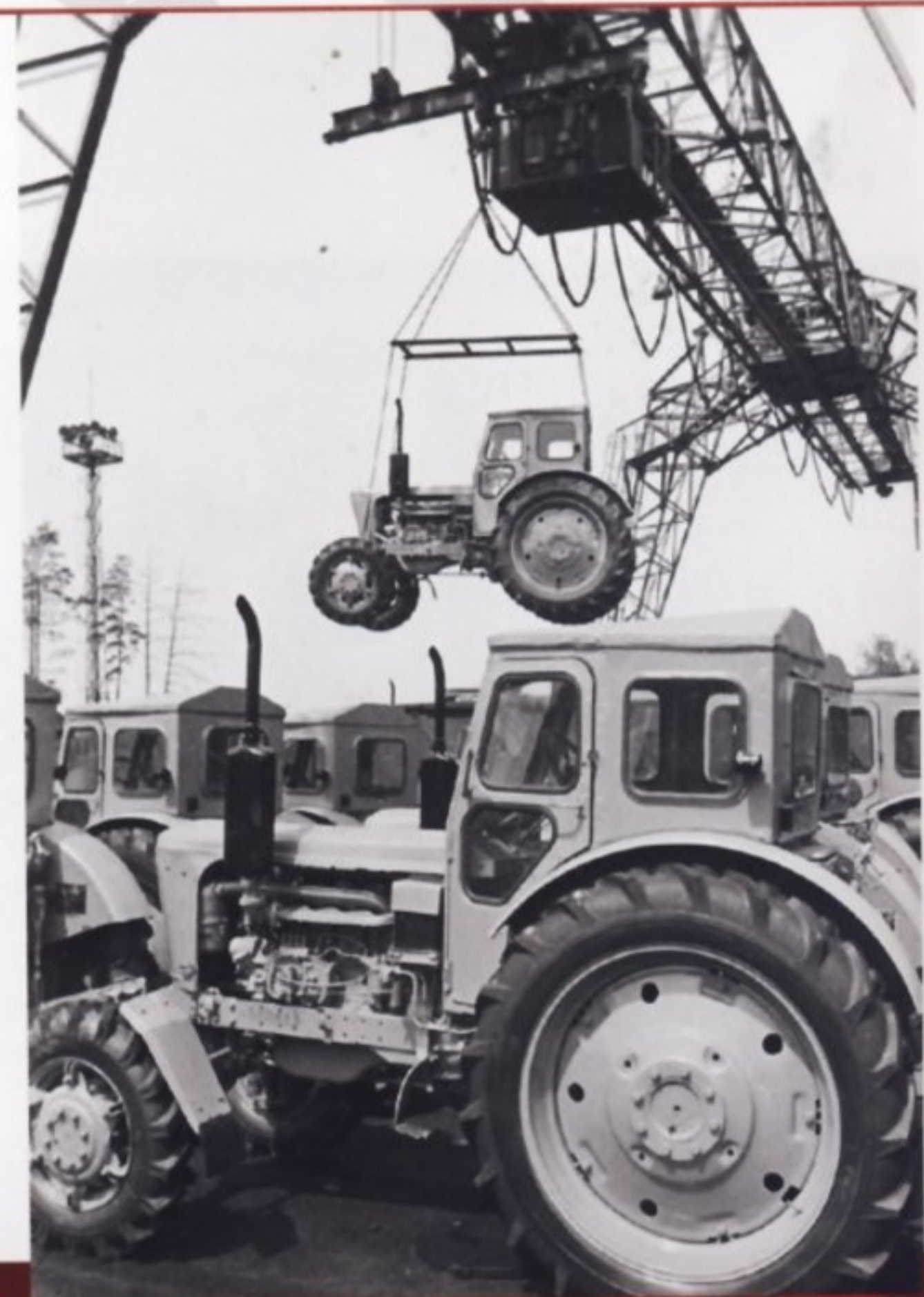
Погрузка тракторов ЛТЗ на железнодорожные платформы.

Модельный ряд тракторов Т-40 производило крупное машиностроительное предприятие – тракторный завод в городе Липецке, расположенном на реке Воронеж, к юго-востоку от Москвы.