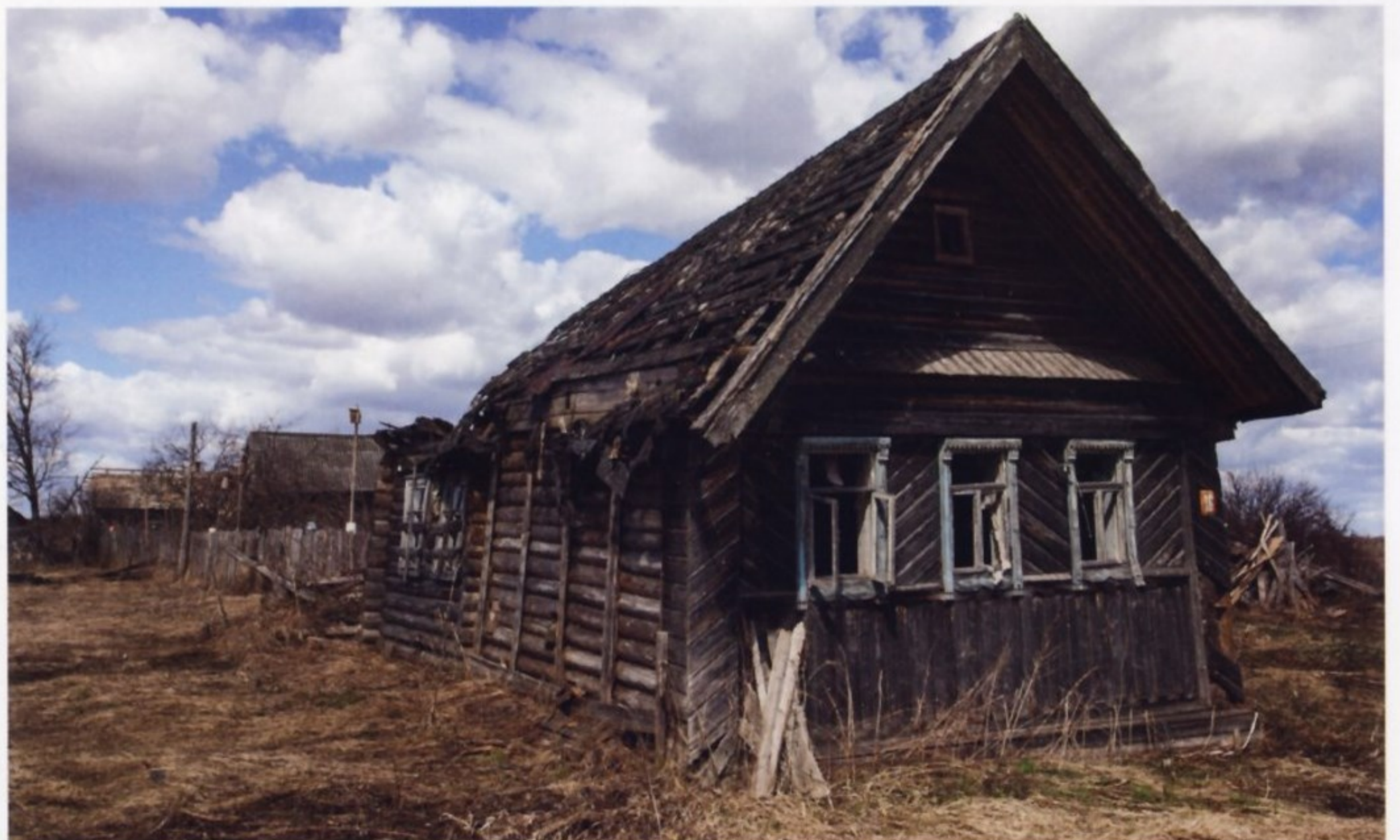
Кампания ликвидации неперспективных деревень нанесла большой ущерб российскому Нечерноземью.

против крестьянства. Он писал: «У нас на Вологодчине из-за «неперспективности» прекратили существование многие тысячи деревень. А по всему северо-западу РСФСР – десятки тысяч. Вдумаемся: из 140 тысяч нечерноземных сел в том регионе предполагалось оставить лишь 29 тысяч!» Статистические данные говорят, что к концу 1970-х там оставалось еще меньше – около 20 тысяч.