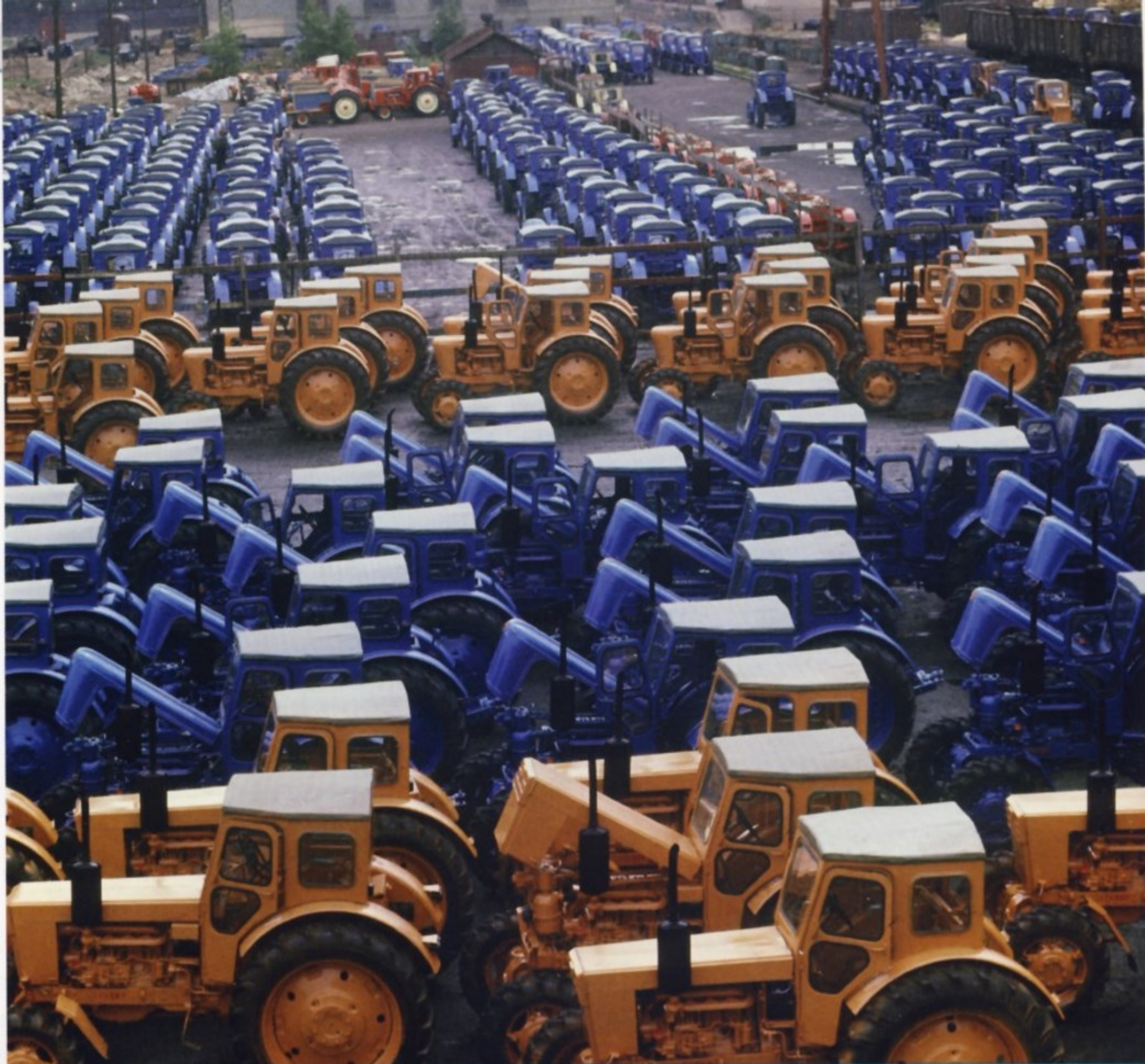
Продукция Липецкого тракторного завода.

Трактор Т-40АНМ (модификация Т-40АМ) имеет уменьшенную общую высоту и повышенную вследствие этого устойчивость. Предназначен для выполнения комплекса сеноуборочных работ, работ общего назначения и транспортировки грузов на склонах до 16° и на равнине.