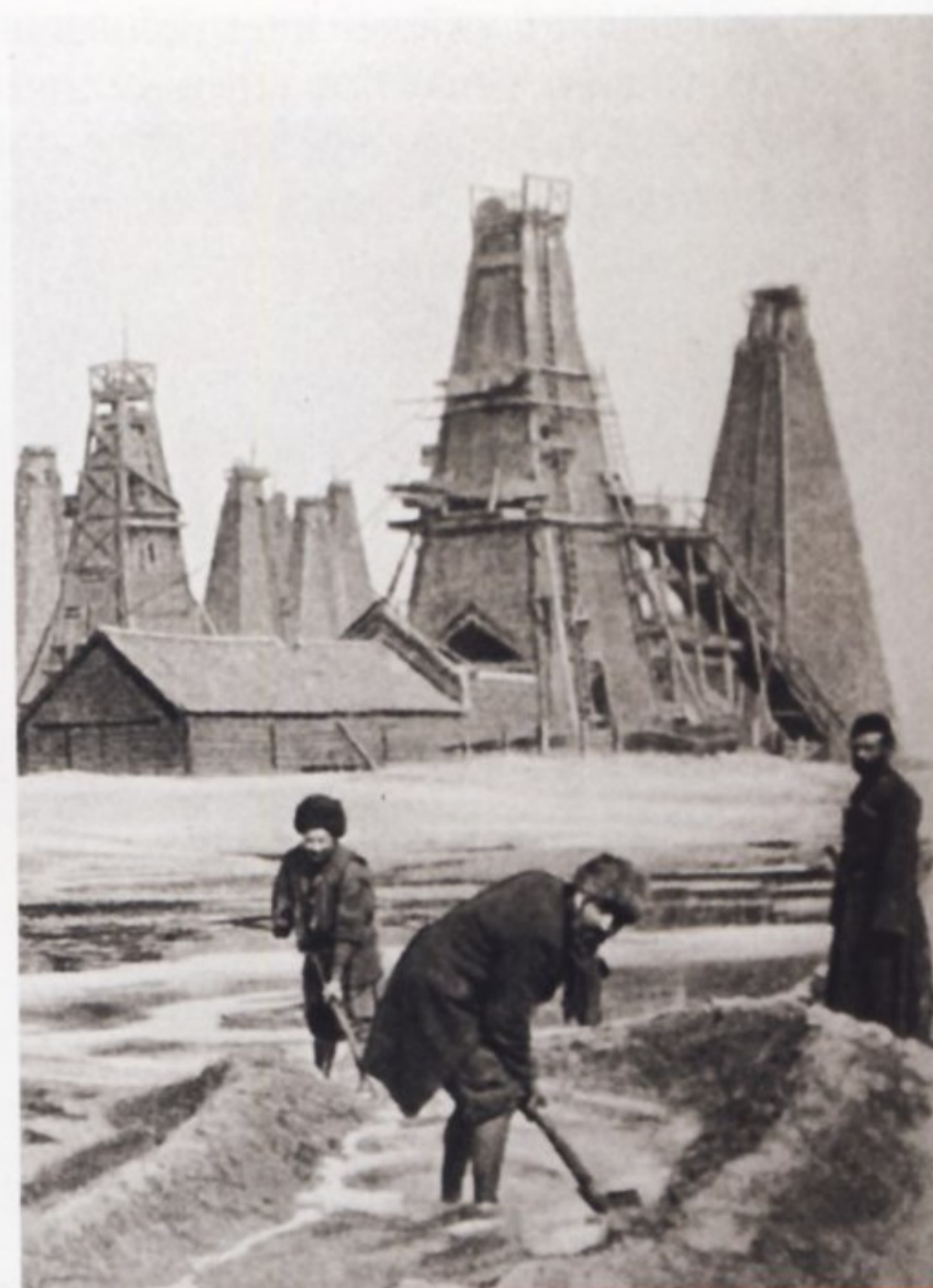
Нефтяные промыслы в Баку, принадлежащие братьям Нобель. Конец XIX в.

«Двигатель революции» был единственным в стране заводом, который выпускал машины собственной конструкции, а не по иностранной лицензии и использовал только отечественные материалы и детали. В 1934 году предприятие полностью перешло на выпуск только бескомпрессорных двигателей.