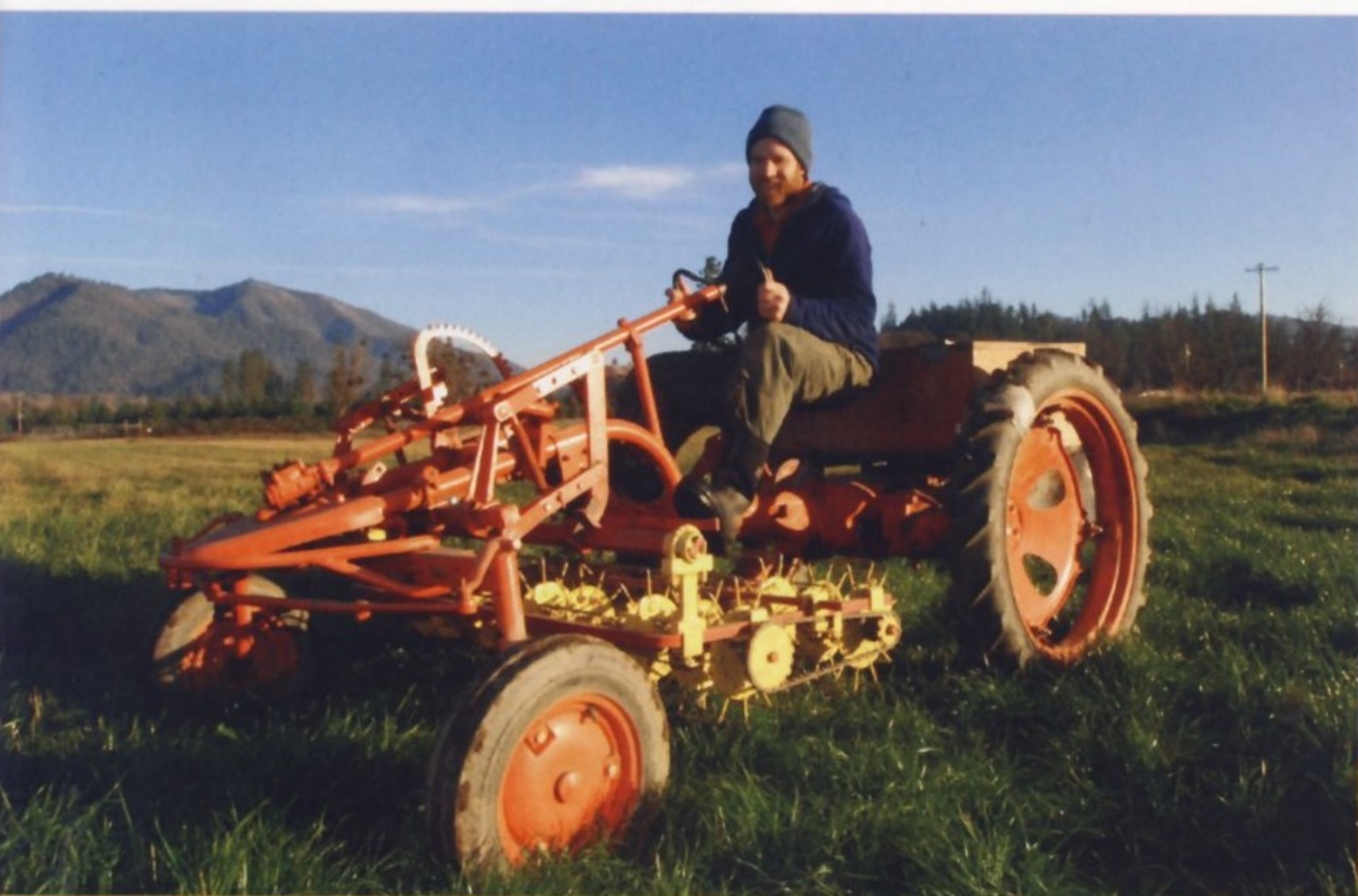
Трактор Allis-Chalmers Model G, на который фермер установил электрический мотор.

В конце 1970-х годов компания заключает соглашения с многочисленными иностранными фирмами, что знаменует конец тракторов Allis-Chalmers, полностью производившихся в США. Легкие модели серии 5000 выпускают в Японии, на итальянских заводах Fiat («Фиат») и даже в Румынии, а новая серия 6000 представляет собой тракторы Renault («Рено»). Серия 8000, выпущенная в 1982 году, стала последней линейкой тракторов Allis-Chalmers. Испытывая финансовые трудности, американская компания заключает сделку с немецкой фирмой Klöckner-Humboldt-Deutz («Клекнер-Гумболд-Дойч»), крупным производителем машин для гражданского строительства, насосов, электродвигателей, турбин, компрессоров и т. д. Тракторы Allis-Chalmers теперь выходят под маркой Deutz-Allis («Дойч-Эллис»), а с 1990 года – AGCO (Allis-Gleaner Corporation).