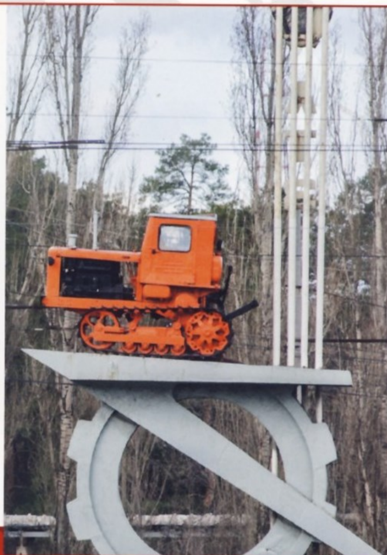
На постаменте памятника ЛТЗ – трактор Т-38, который собирали на заводе с 1957 по 1961 год.

Липецкий тракторный длительный время был единственным предприятием, выпускавшим трактор интегральной схемы. ЛТЗ-100, ЛТЗ-150, ЛТЗ-145, ЛТЗ-155 – это разные наименования такой машины, а индексацию меняли по мере того, как росла мощность двигателя. Конструкция этой модели соответствовала модульной конструкции: кабина располагалась в центре и имела круговое остекление, быстро реверсируемый поворотный пост управления позволял использовать машину на челночных работах, двигатель находился в переднем блоке, а в заднем была закреплена трехточечная навеска или рабочее оборудование. Осевая развесовка была уравнена до 50/50, что позволяло балластировать переднюю или заднюю часть, не боясь, что загруженный мост зароется в землю на мягком грунте. Балластное качание заднего моста относительно остова на угол \pm 11^\circ обеспечивало постоянный контакт колес с почвой и раздельное копирование рельефа передними и задними орудиями. Передовая для своего времени, модель появилась на рынке только в 1990-х годах и потому быстро утратила конкурентное преимущество.