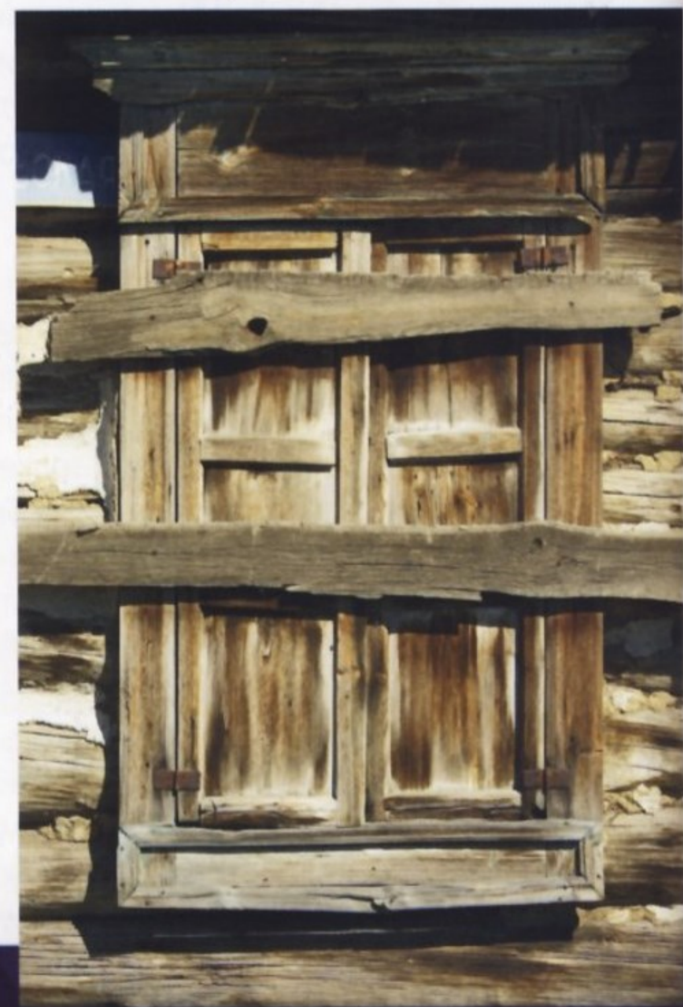
Где нашли кров жители опустевшей деревни – не известно.

Когда в Липецке начался выпуск трактора Т-40АМ, в СССР в самом разгаре была кампания, которая получила название «ликвидация неперспективных деревень» и фактически привела к вымиранию деревни в Нечерноземье РСФСР.