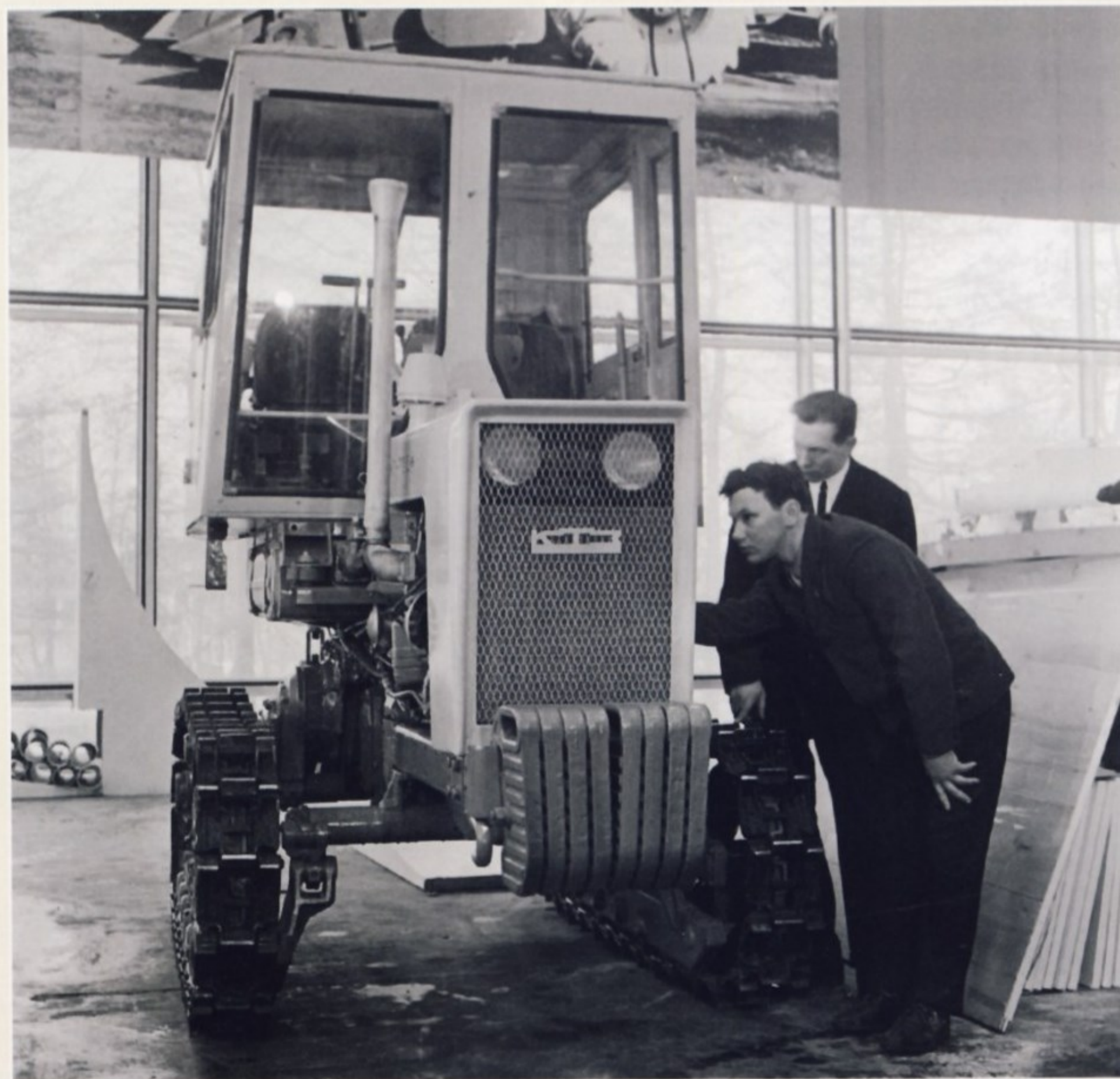
Работники Кишиневского тракторного завода осматривают трактор Т-40.