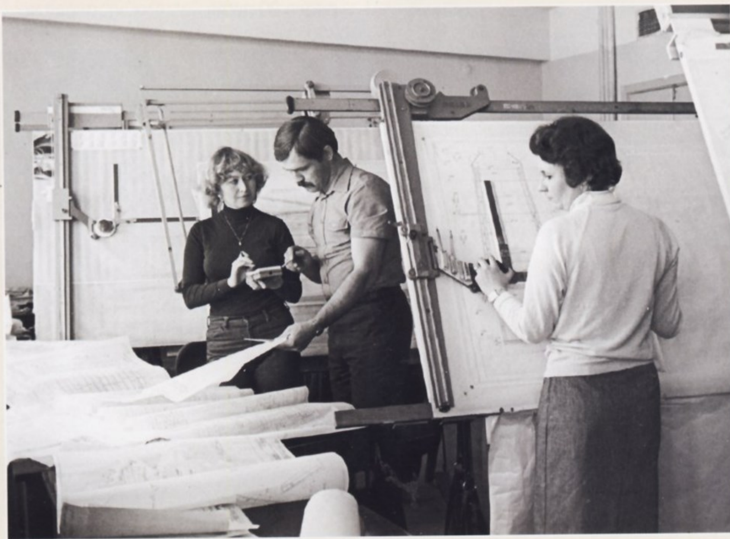
В конструкторском бюро Липецкого тракторного завода.

На некоторое время промышленность в Липецке приостановила свое развитие, и город стал больше известен своими минеральными водами и революционерами из тайной организации «Народная Воля». Однако вскоре на базе Липецких рудников восстановилось металлургическое производство.