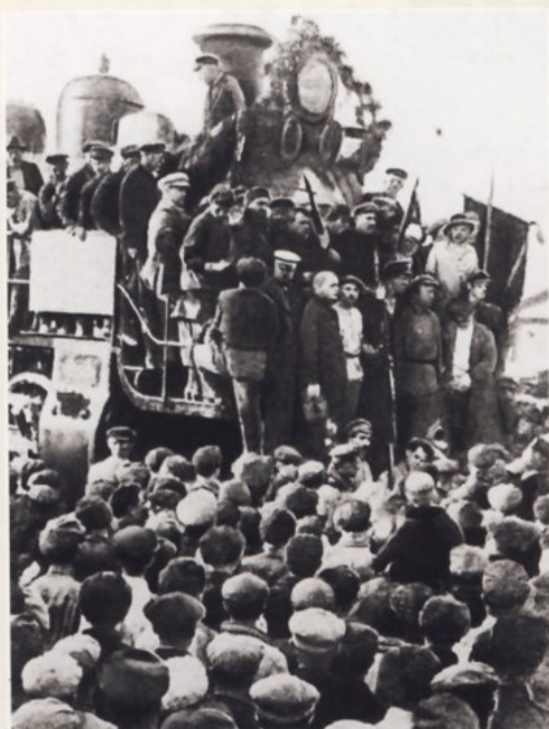
В 1920-х годах продолжалось широкое производство паровых двигателей. Например, для паровозов.

Серийный выпуск бескомпрессорного мотора начался в 1926 году на заводе «Двигатель