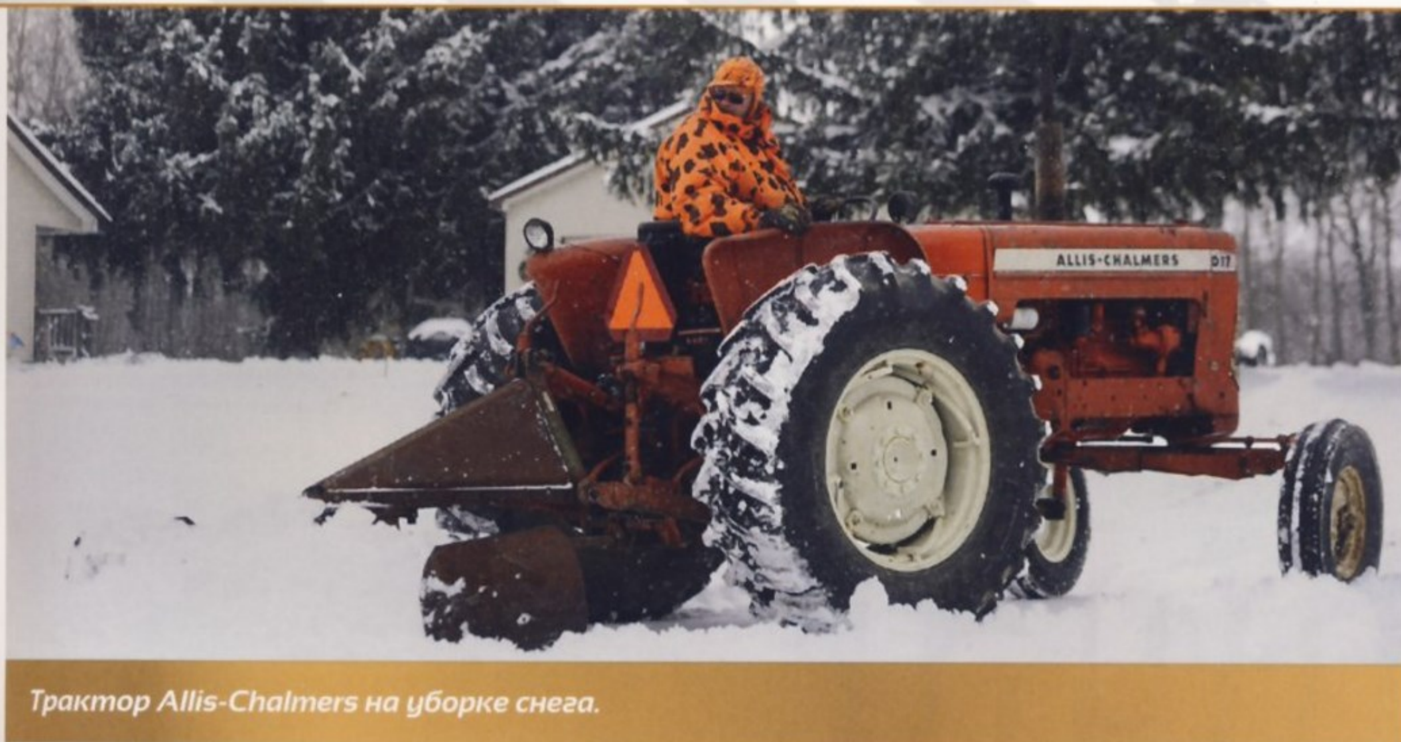
Трактор Allis-Chalmers на уборке снега.

Производство трактора В переносится в Англию, сначала в Саутгемптон, а затем в Эссендайн на западе страны. Теперь эту машину называют D-270, она позволяет боковое агрегатирование, а также может оснащаться бензиновым или керосиновым двигателем с верхним расположением клапанов или дизельным двигателем Perkins P3.