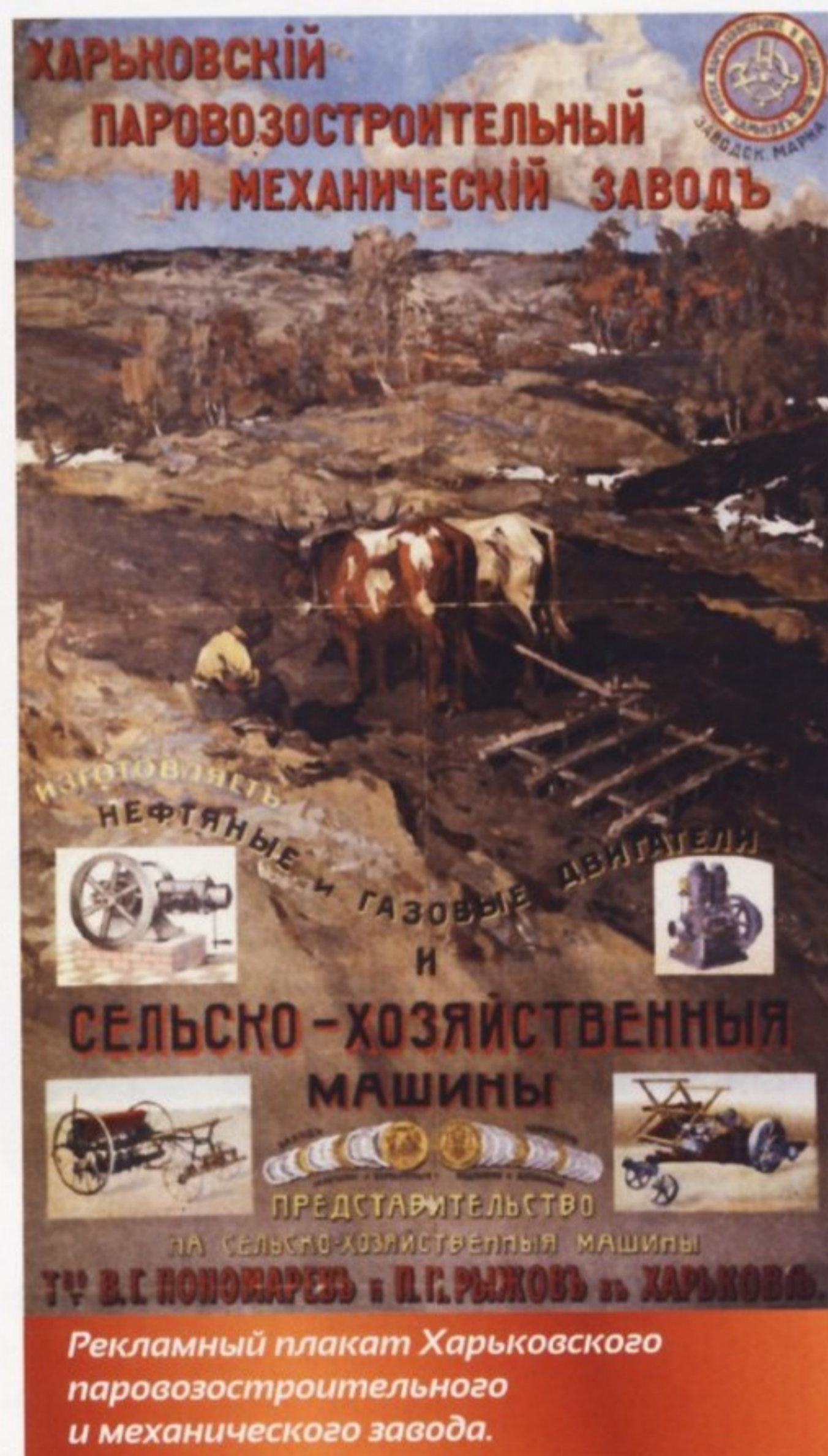
Рекламный плакат Харьковского паровозостроительного и механического завода.