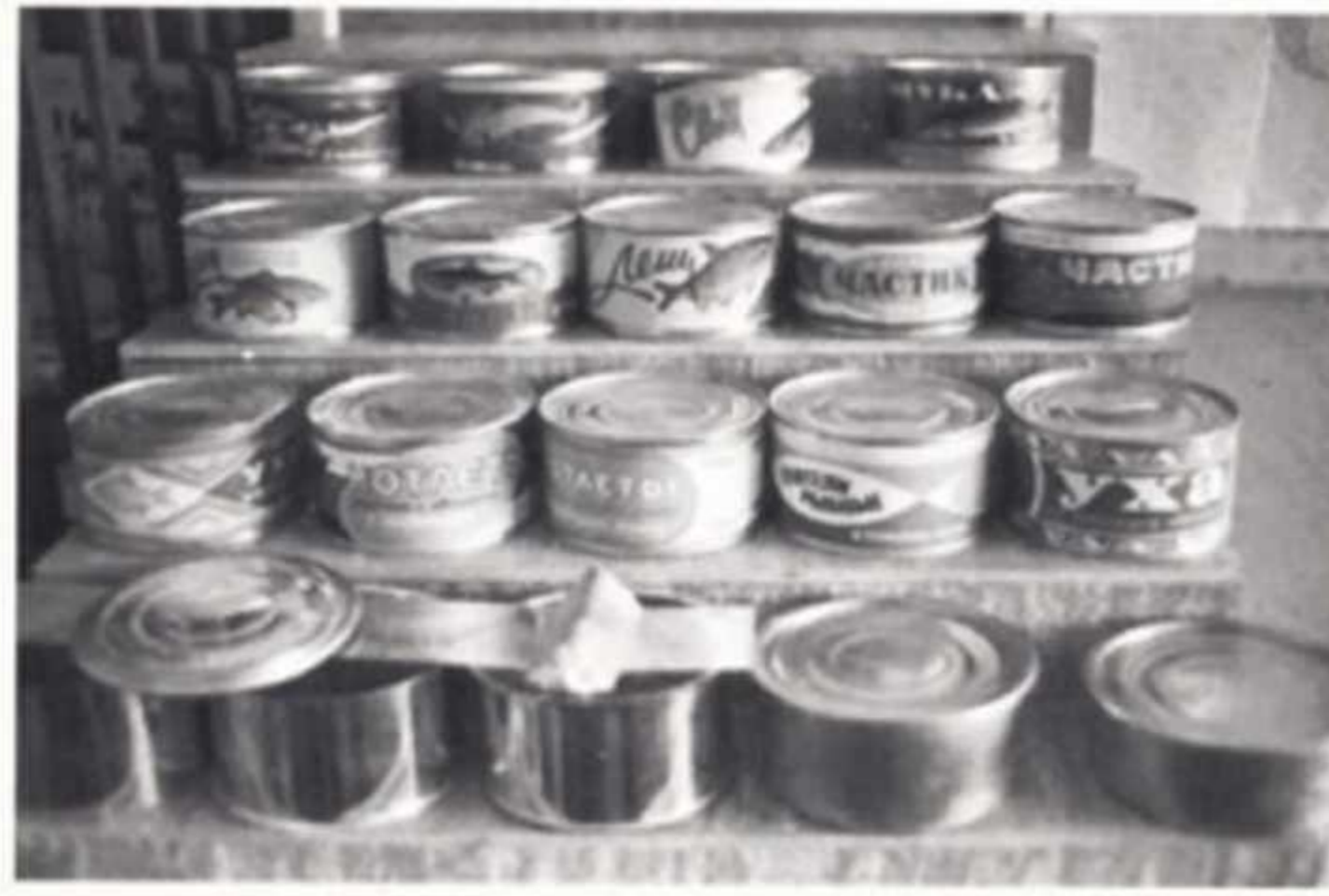
Рыбные консервы, выпускавшиеся Муйнакским рыбоконсервным комбинатом. Каракалпакская АССР (Узбекская ССР).

Ситуацию с зерном усугубляли отношения с советским сектором в Европе. В 1950-х годах в государствах Восточной Европы начинаются волнения. Советский Союз не только применяет кнут – военную силу, но и пряник – поддерживает восточноевропейские социалистические страны поставками зерна. Это часть платы за стабильность. Лишь в 1963 году руководство СССР принимает решение о прекращении поддержки восточно-европейских стран советским зерновым экспортом.