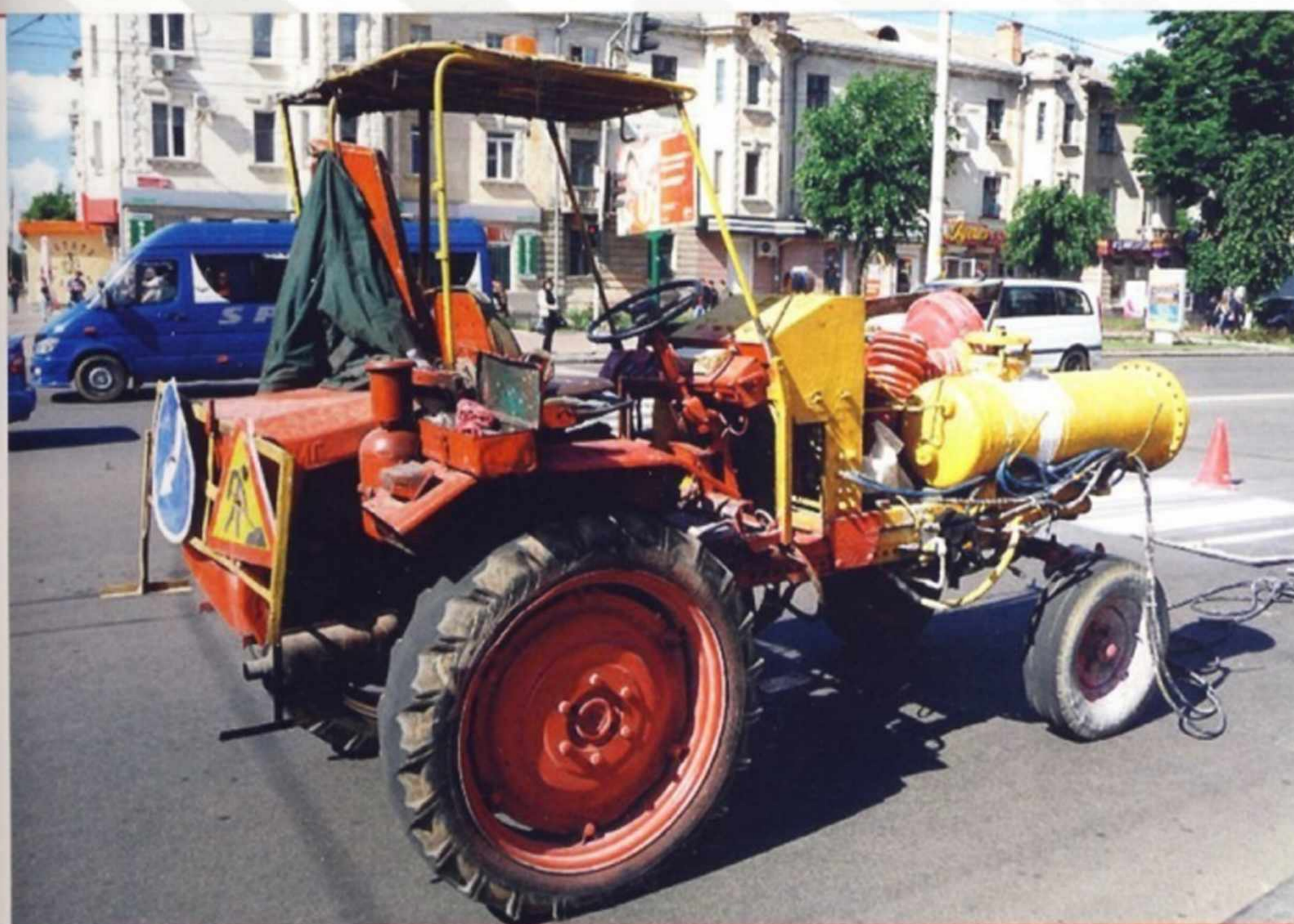
Самоходное шасси (трактор) Т-16МГ, используемое для нанесения дорожной разметки.

а также его модификации: СШ-28А и СШ-28Т. Кроме этого, завод разработал малогабаритный трактор АТ-1, унифицированный с Т-16М на 85 %.