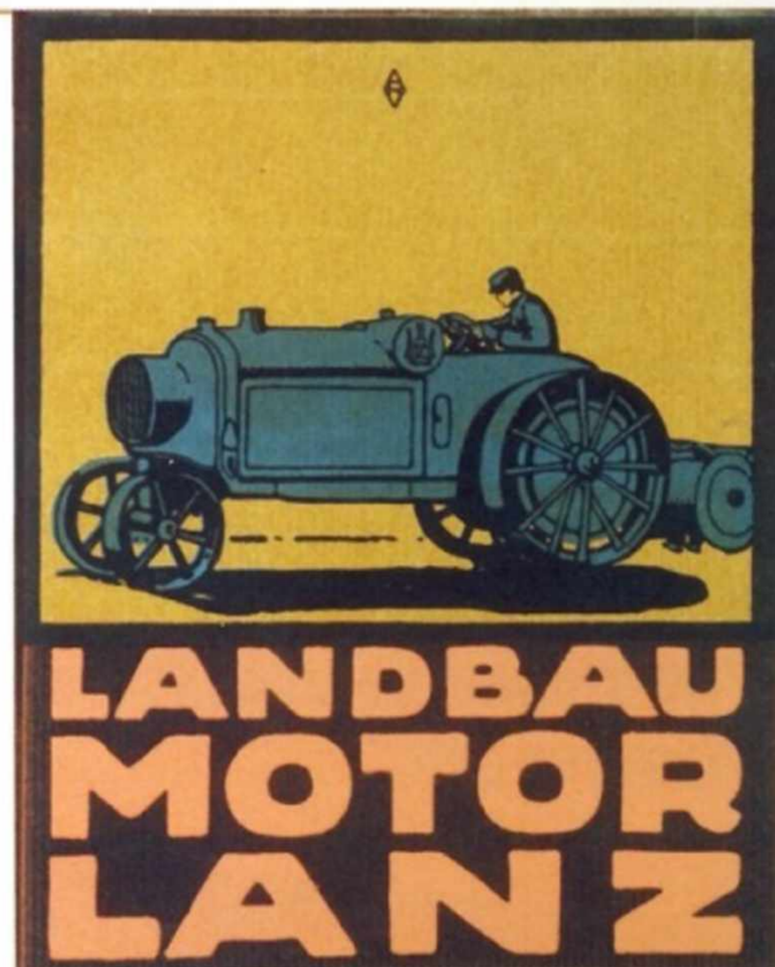
Каталог компании Lanz. 1915 г.

С 1950 года используют электрический стартер в сочетании с размещенной в отделении под платформой аккумуляторной батареей напряжением 12 В. Закругленные крылья корпуса заменяют плоскими, грабленными, чугунные крышки топливного бака – крышками из штампованной стали, на ободу передних колес появляются четыре