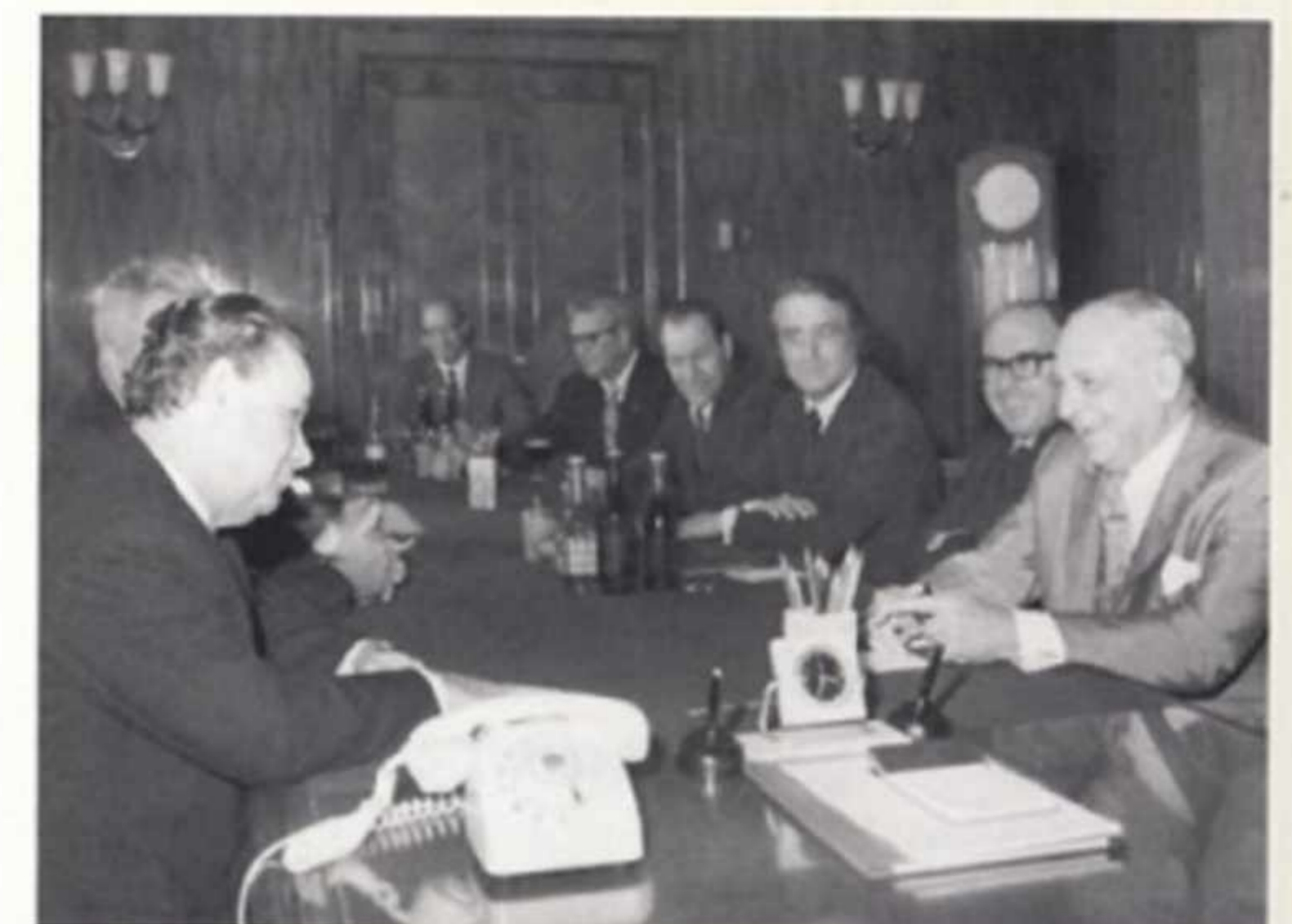
Министр внешней торговли СССР Н. С. Патоличев и председатель американской корпорации Арманд Хаммер на переговорах. Москва. 1972 г.

торговли. Когда в начале 1960-х годов страна столкнулась с острой потребностью в финансировании импорта продуктов питания, руководители государства могли бы надеяться, что его удастся обеспечить за счет экспорта товаров обрабатывающей промышленности. Но, увы, руководство прекрасно знало, что продукция гражданского машиностроения в подавляющей части неконкурентна на мировом рынке. Итак, в 1960-х годах СССР стал крупнейшим нетто-импортером продовольствия. К тому же Советский Союз никогда не создавал крупных резервов валюты, поддерживая их на уровне, достаточном для обслуживания текущего торгового оборота. Проблема представлялась практически неразрешимой. Временное спасение пришло от наращивания добычи нефти. В 1960 году ее добывали более 100 млн тонн, через 5 лет – более 200 млн, в 1970-м – более 300 млн.