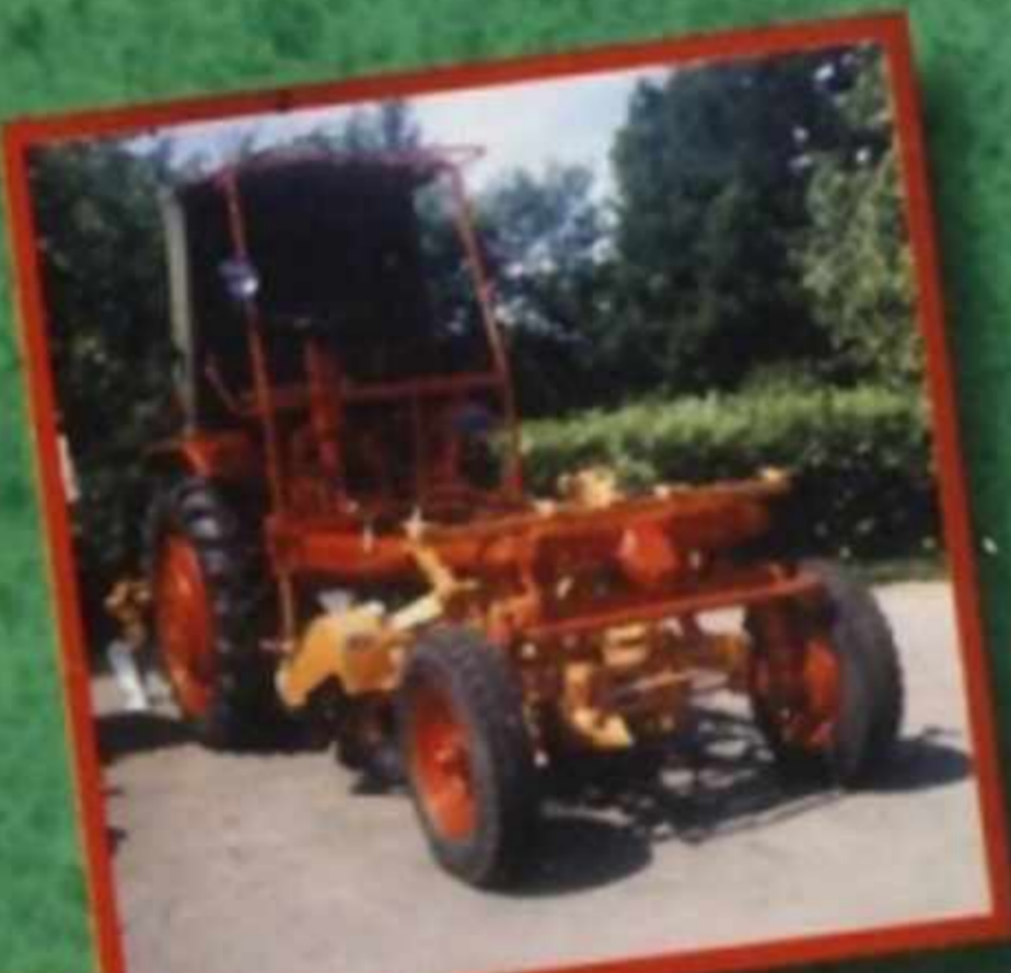
Самоходное шасси Т-16М