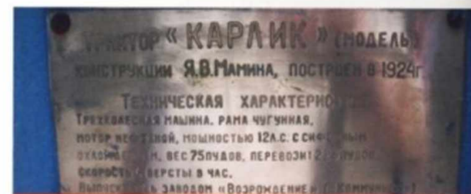
Табличка трактора «Карлик».