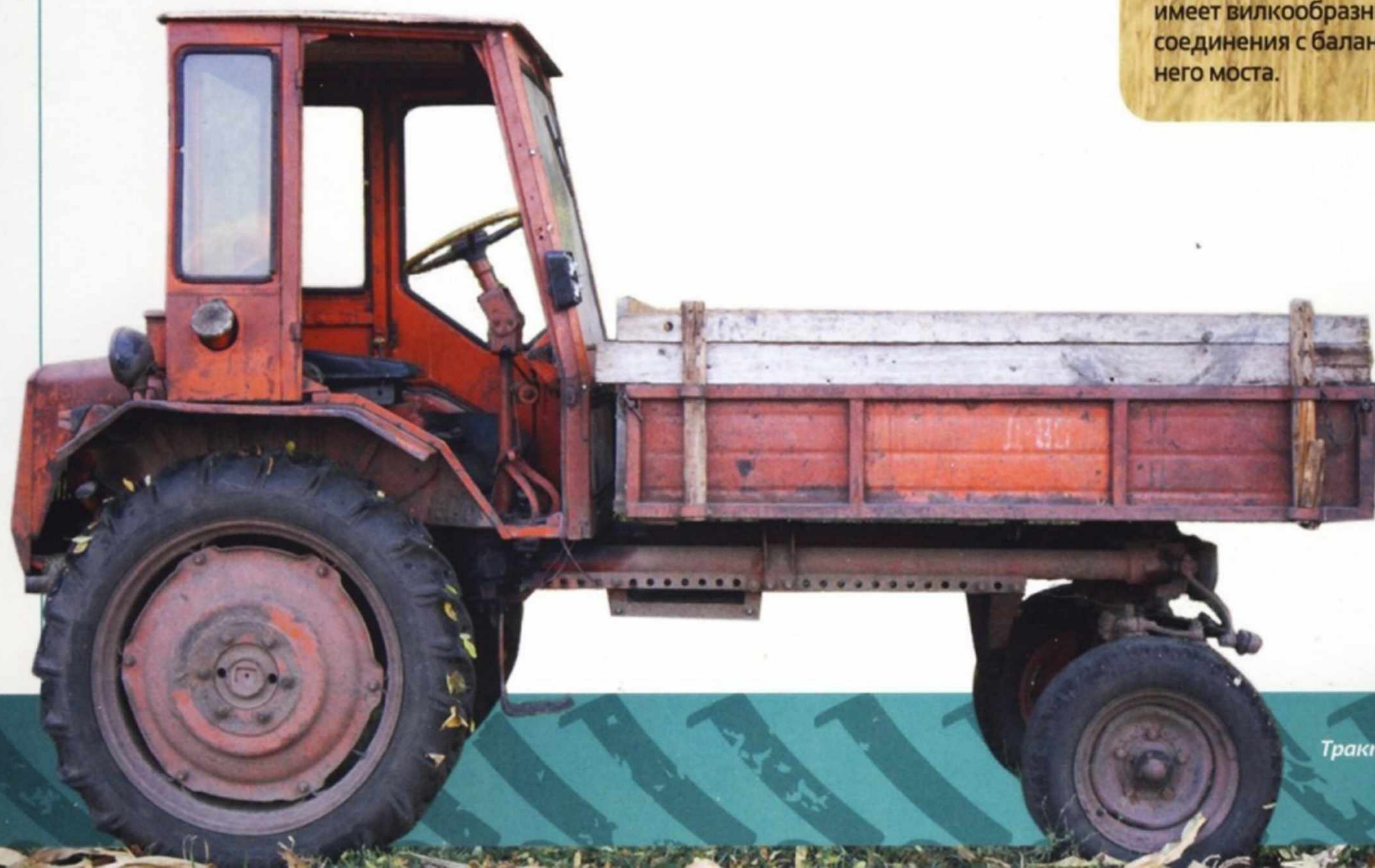
Трактор Т-16 ДВШ.

Внутри литой полости заднего бруса две перегородки. В их отверстия запрессованы втулки поперечного вала рулевого управления. Внутренняя полость заднего бруса используется и в качестве масляной емкости гидросистемы. К левой трубе рамы приварены кронштейны крепления гидрораспределителя и опоры аккумуляторных батарей. Передний брус имеет вилкообразный прилив для соединения с балансиром переднего моста.