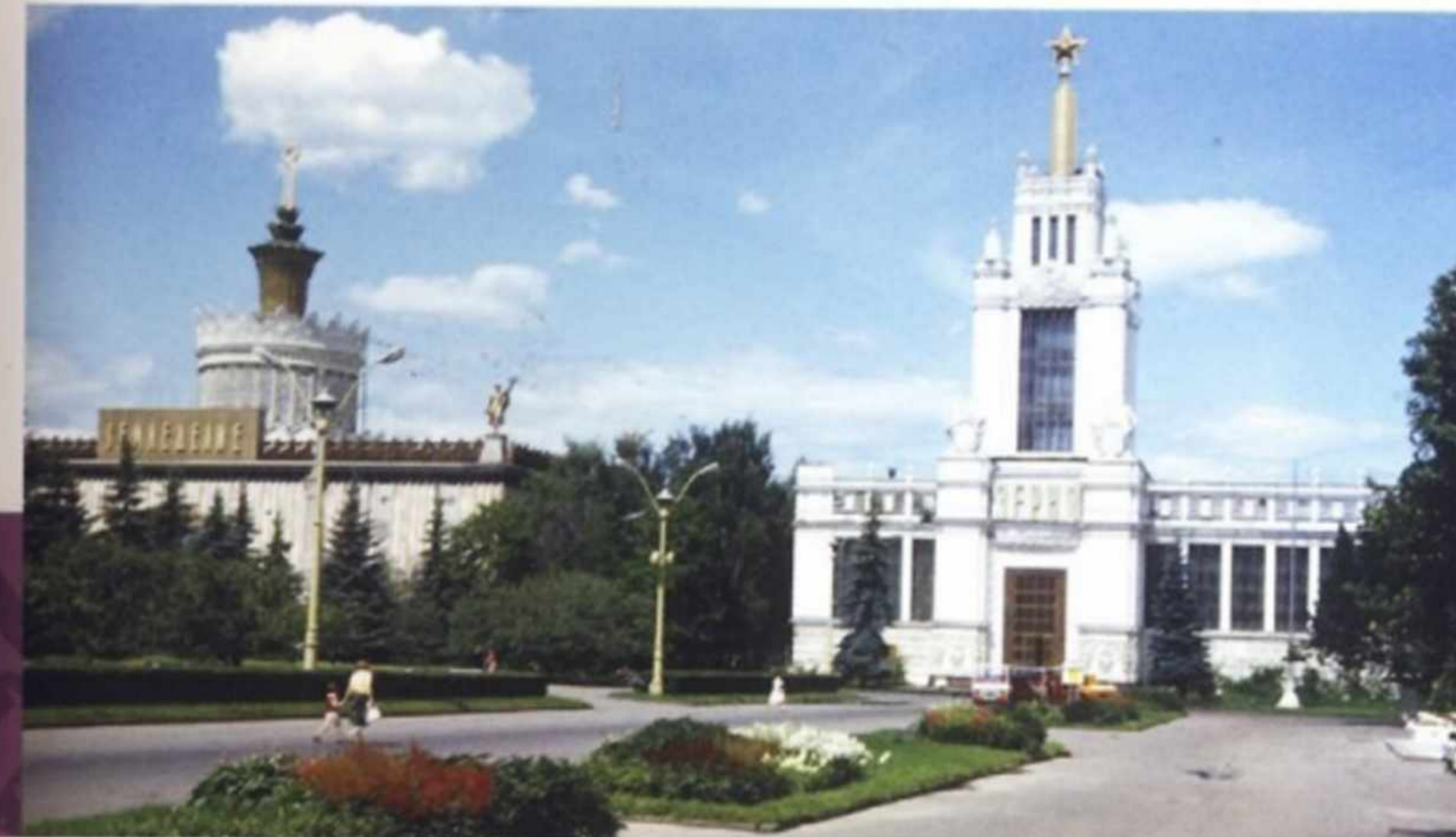
ВДНХ СССР. Павильоны «Зерно» и «Земледелие». 1980 г.

Возрождались звеньевая система организации производства: от крупных бригад переходили к небольшим звеньям, отвечающим за весь технологический цикл, с оплатой труда по количеству и качеству произведенной продукции. Применение такой системы