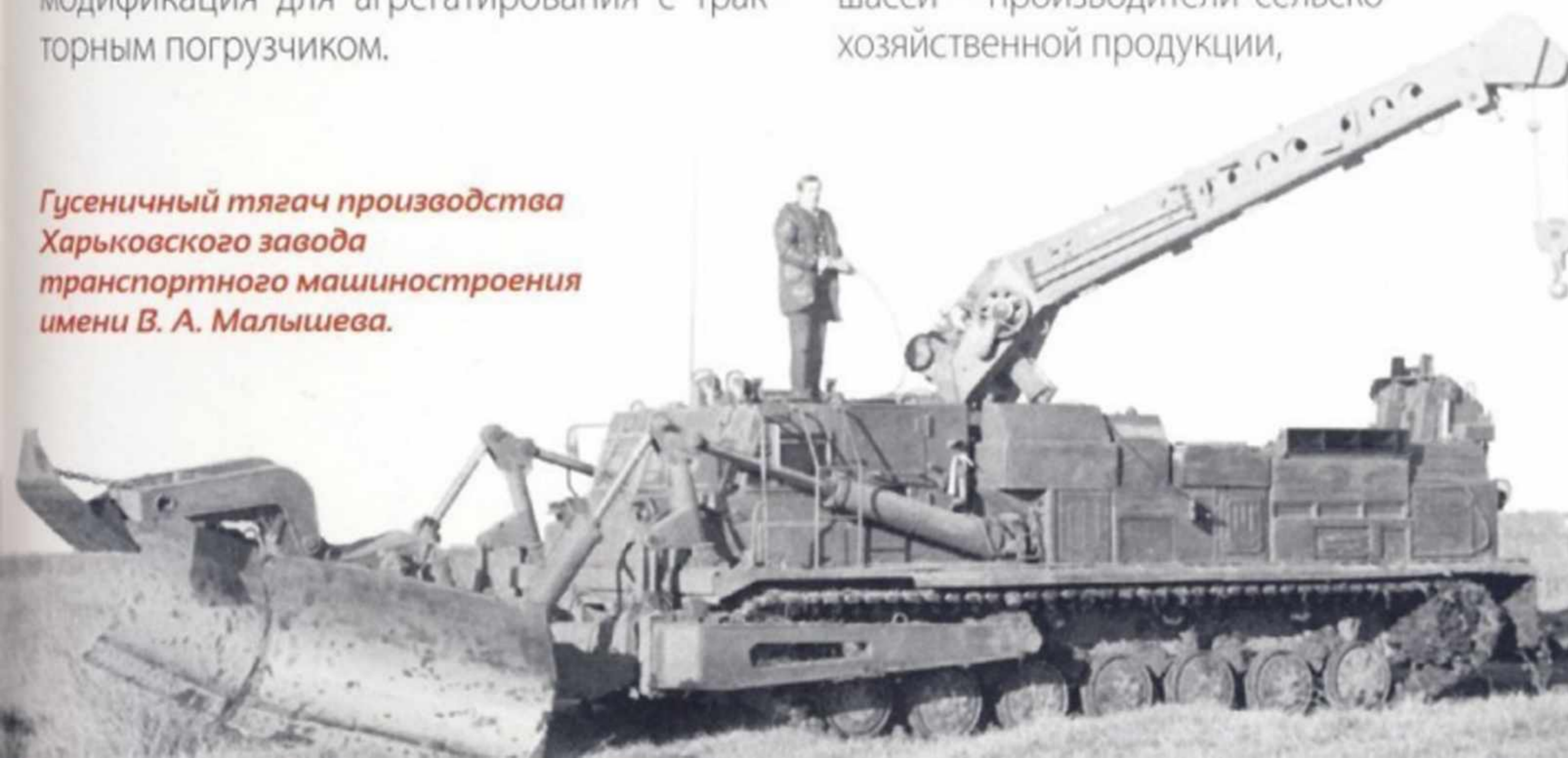
Гусеничный тягач производства Харьковского завода транспортного машиностроения имени В. А. Малышева.

которые используют их в растениеводстве (в основном на выращивании технических культур, овощей и винограда), животноводстве и на транспортных работах. Т-16 активно применяют и промышленные предприятия, как правило, в качестве технологического транспорта или для выполнения специализированных работ.