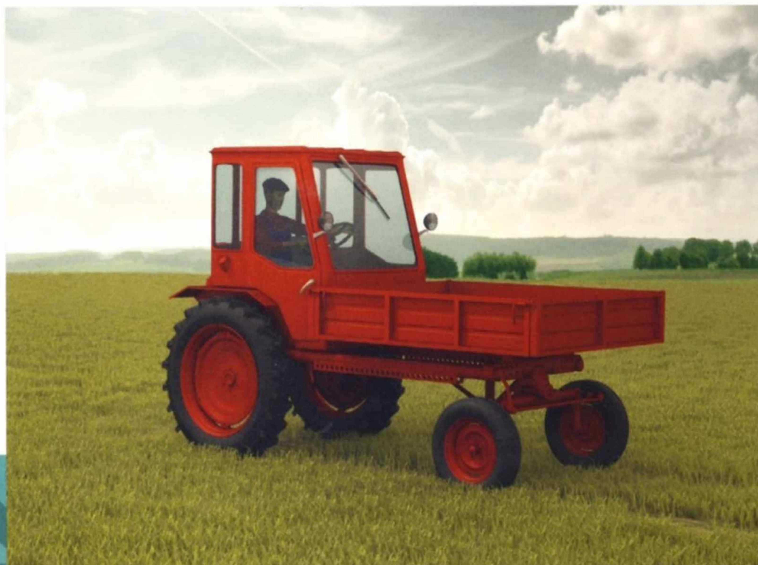
Трактор Т-16 в поле.

сельскохозяйственными приспособлениями и агрегатами: плугом, пропашным культиватором, сеялкой, картофелекопалкой, окучником, грузовой самосвальной платформой, погрузчиками различных типов, мотопилой, грейдерной лопатой, щеткой для чистки дорог (устанавливается под рамой),