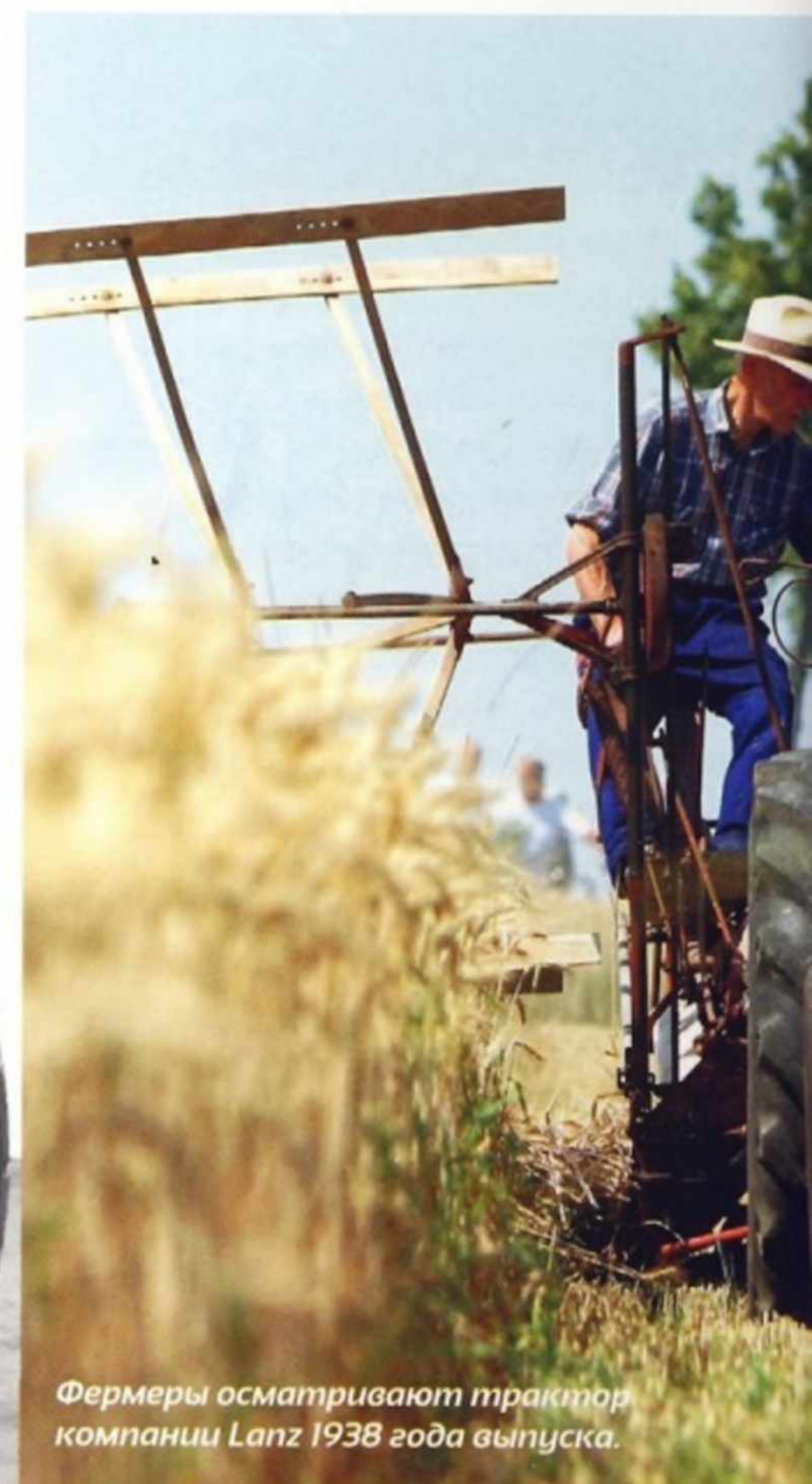
Фермеры осматривают трактор компании Lanz 1938 года выпуска.