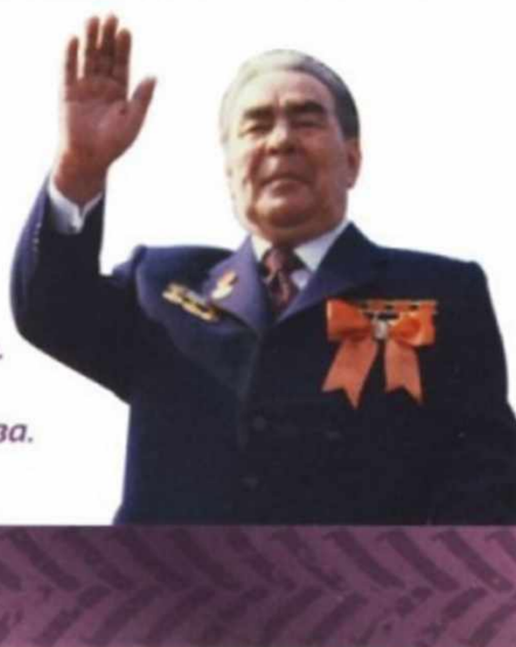
Генеральный секретарь ЦК КПСС Л. И. Брежнев. Мавзолей Ленина. Москва. 1 мая 1980 г.

порой приводила к значимым перебоям, особенно в малых городах, доступность продуктов и уровень удовлетворенности населения оставались низкими. В это время широко распространилось явление «дефицита», который надо «доставать по блату». В этих условиях росло потребление тех групп населения, которые имели доступ к соответствующим видам продукции (партийная верхушка, работники торговли и общественного питания, работники оборонных предприятий, жители «закрытых» городов и т. д.), за счет сокращения потребления прочих групп населения. К сожалению, это особенно сильно сказывалось на малообеспеченных семьях.