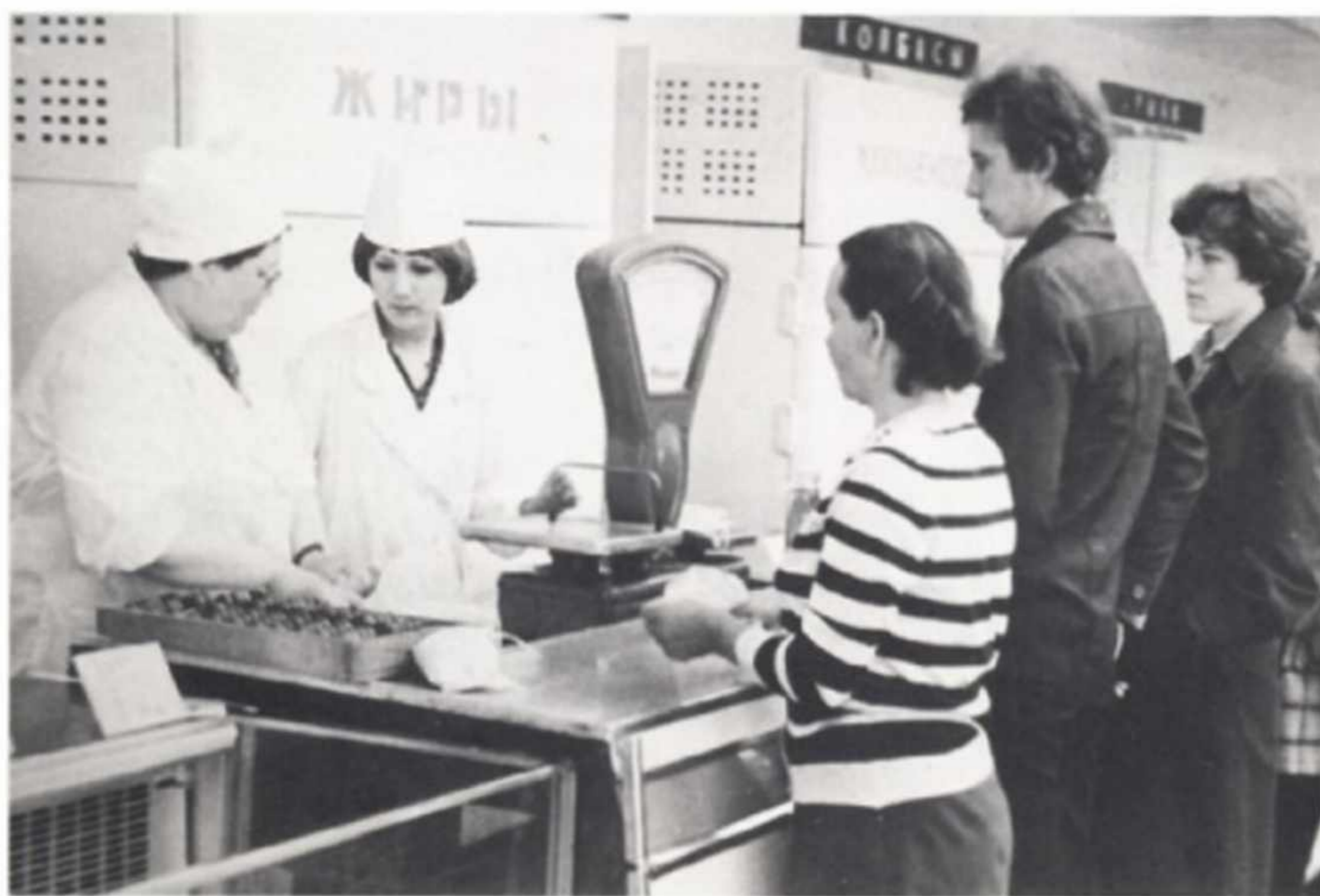
Очередь в мясной отдел универсама.

порой приводила к значимым перебоям, особенно в малых городах, доступность продуктов и уровень удовлетворенности населения оставались низкими. В это время широко распространилось явление «дефицита», который надо «доставать по блату». В этих условиях росло потребление тех групп населения, которые имели доступ к соответствующим видам продукции (партийная верхушка, работники торговли и общественного питания, работники оборонных предприятий, жители «закрытых» городов и т. д.), за счет сокращения потребления прочих групп населения. К сожалению, это особенно сильно сказывалось на малообеспеченных семьях.