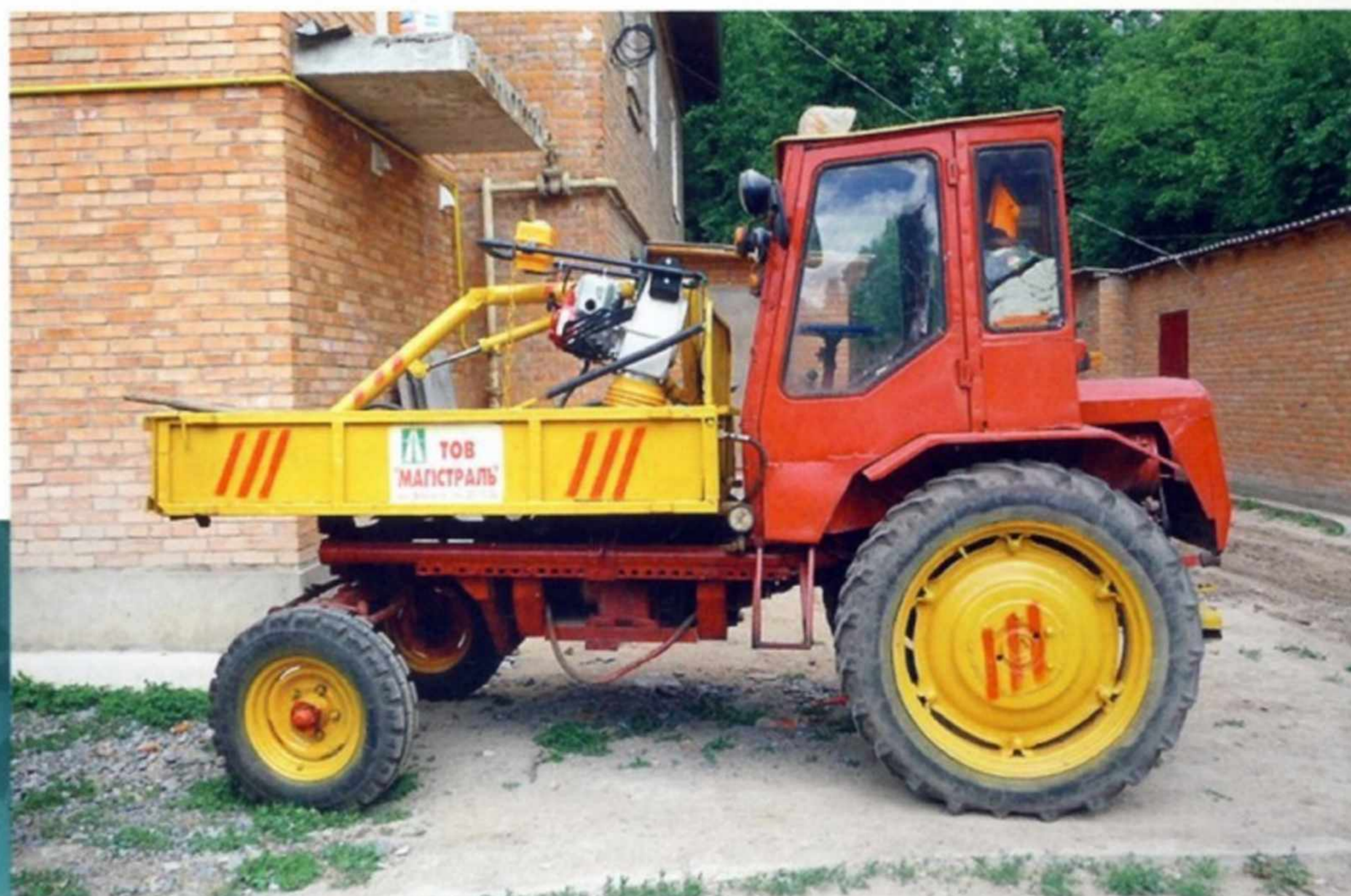
Трактор Т-16М с закрытой кабиной.

использовали для работы в овощеводстве, опрыскивания деревьев, перевозки небольших грузов в труднопроходимых местах. Также его применяли в малых строительных бригадах, для перевозки камней, песка, древесины, лебедок, пилорам, сварочных аппаратов и т. д. Затем он завоевал популярность и в других сферах: его стали применять автодорожные, коммунальные предприятия и организации, фермеры и сельские жители (в индивидуальном хозяйстве).