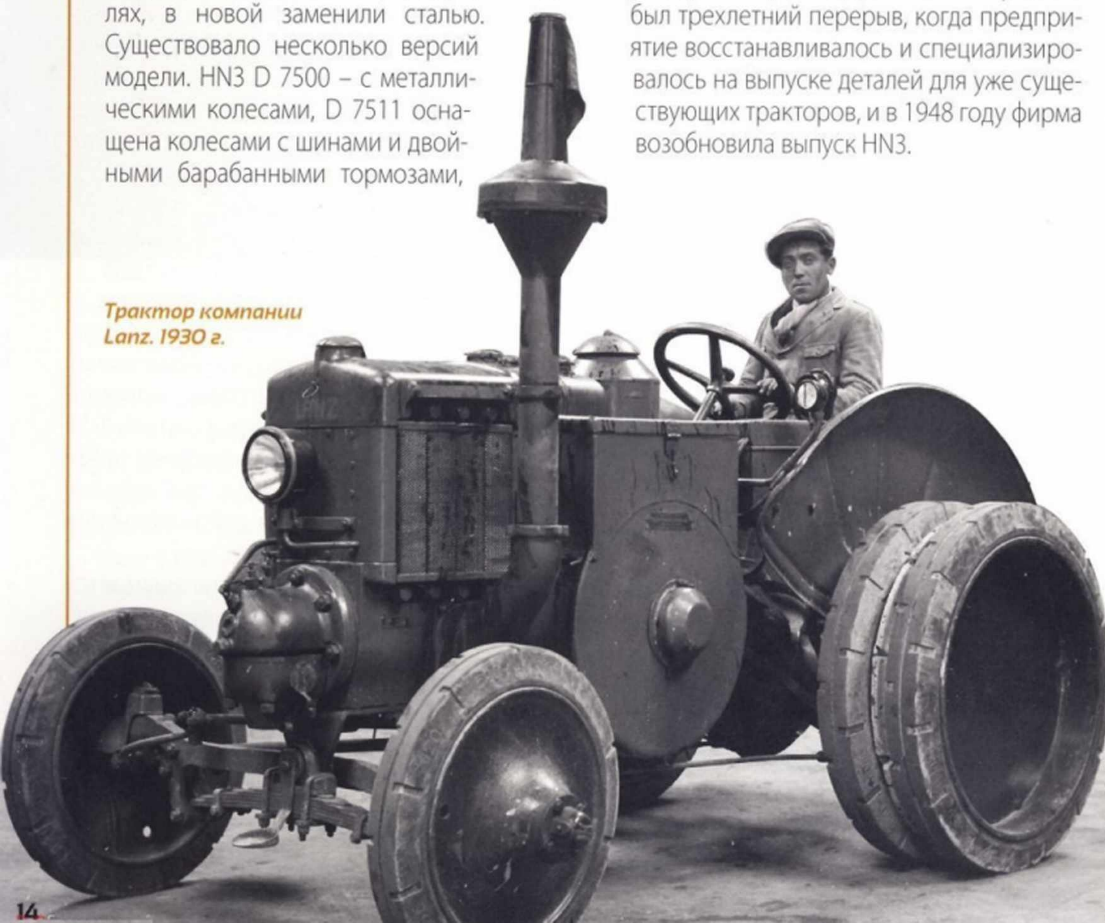
Трактор компании Lanz. 1930 г.

Трактор HN3 производили всю войну. Затем был трехлетний перерыв, когда предприятие восстанавливалось и специализировалось на выпуске деталей для уже существующих тракторов, и в 1948 году фирма возобновила выпуск HN3.