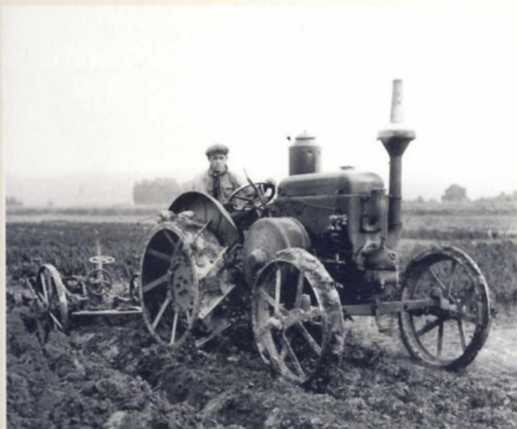
Трактор компании Lanz с плугом. 1929 г.

Общая продукция тракторов HN3 после войны (с 1948 по 1952 год) составляет от 17 000 до 18 000 экземпляров, в том числе 7 310 тракторов Allzweck. Таким образом, вместе с довоенными число тракторов этой марки – более 30 000 экземпляров.