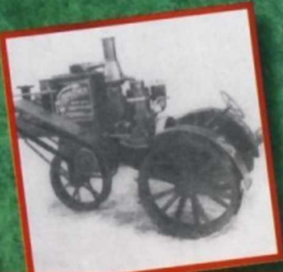
Колесный трактор «Карлик»