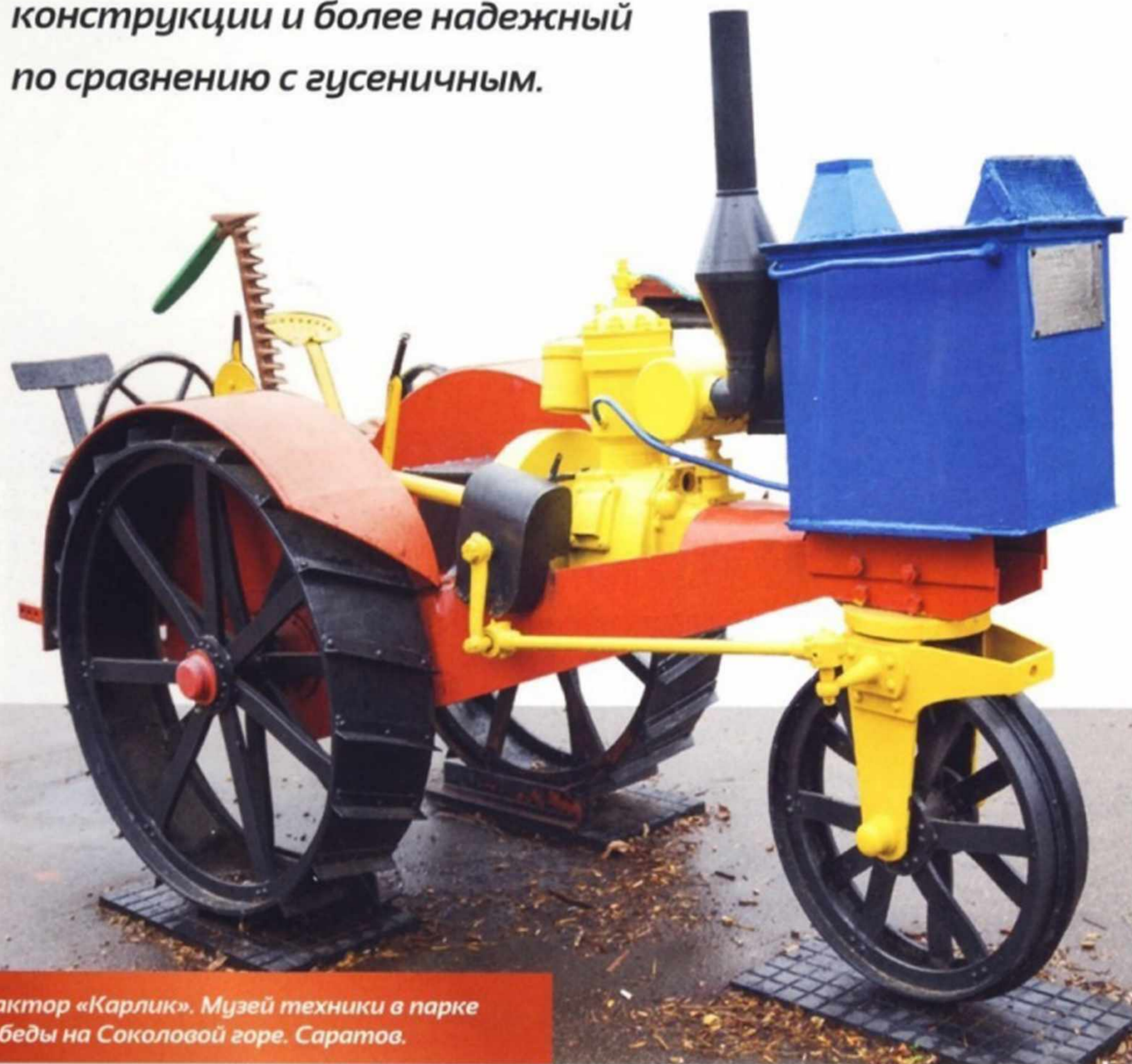
Трактор «Карлик». Музей техники в парке Победы на Соколовой горе. Саратов.