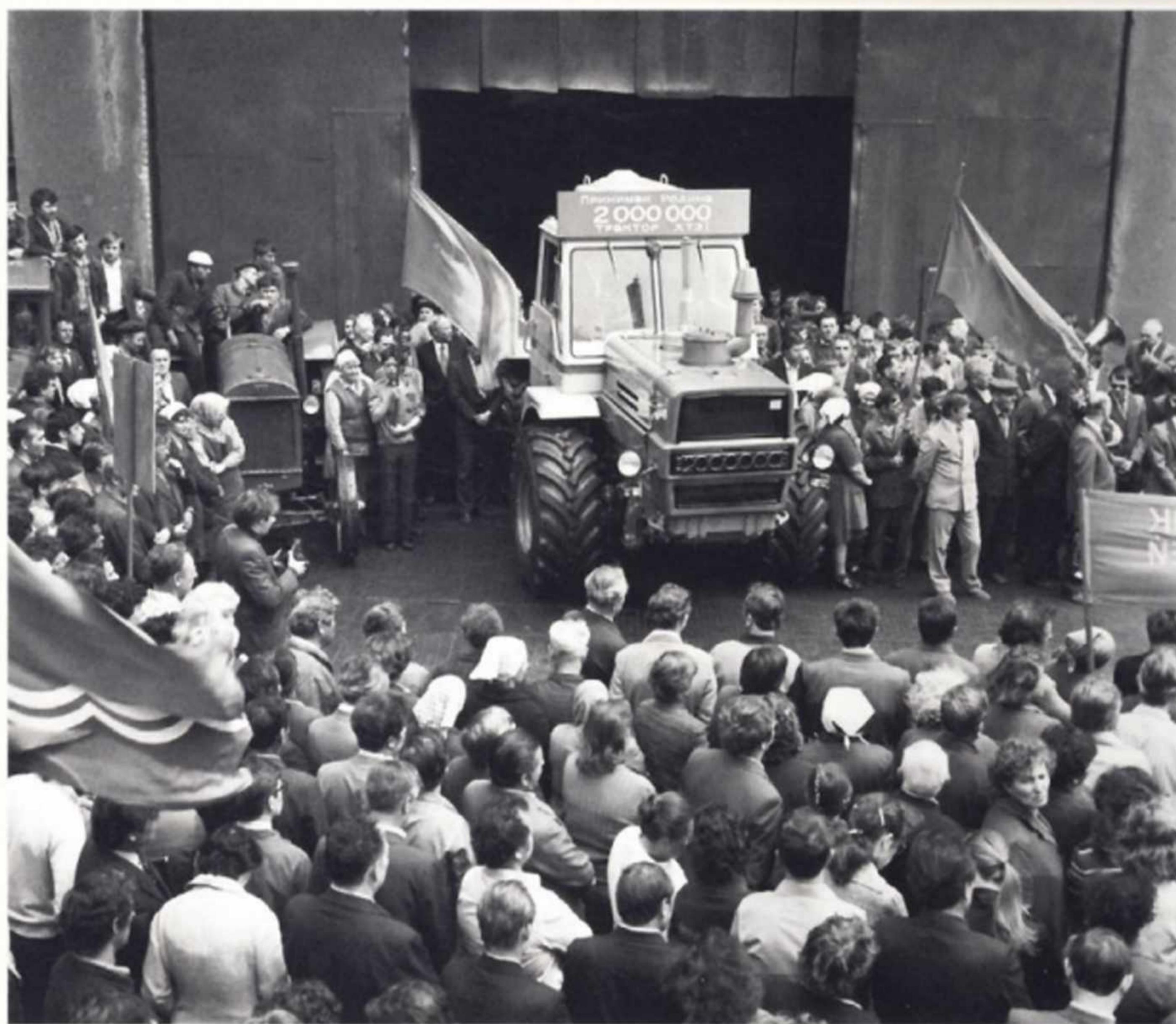
Двухмиллионный трактор Т-150 выходит из ворот Харьковского тракторного завода. 1982 г.

Харьковский завод тракторных самоходных шасси (ХЗТСШ), основанный в 1949 году, специализировался на небольшой мобильной технике для сельского хозяйства, прежде всего овощеводства, и коммунально-дорожных работ. Подобную технику выпускает и его преемник – ООО «Завод самоходных шасси».