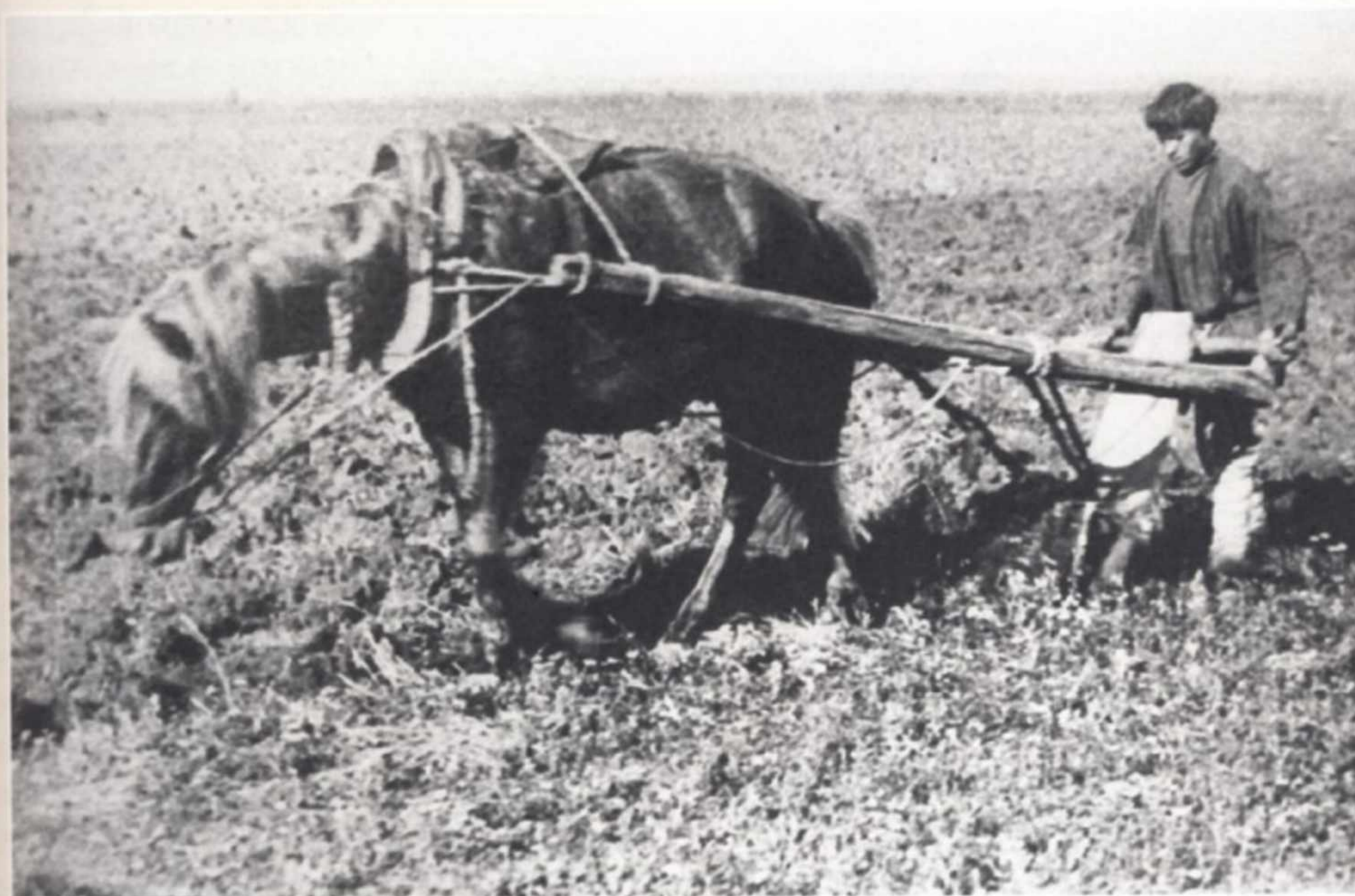
Крестьянин во время пахоты. Деревня Михайловка, Пензенская область. 1898 г.