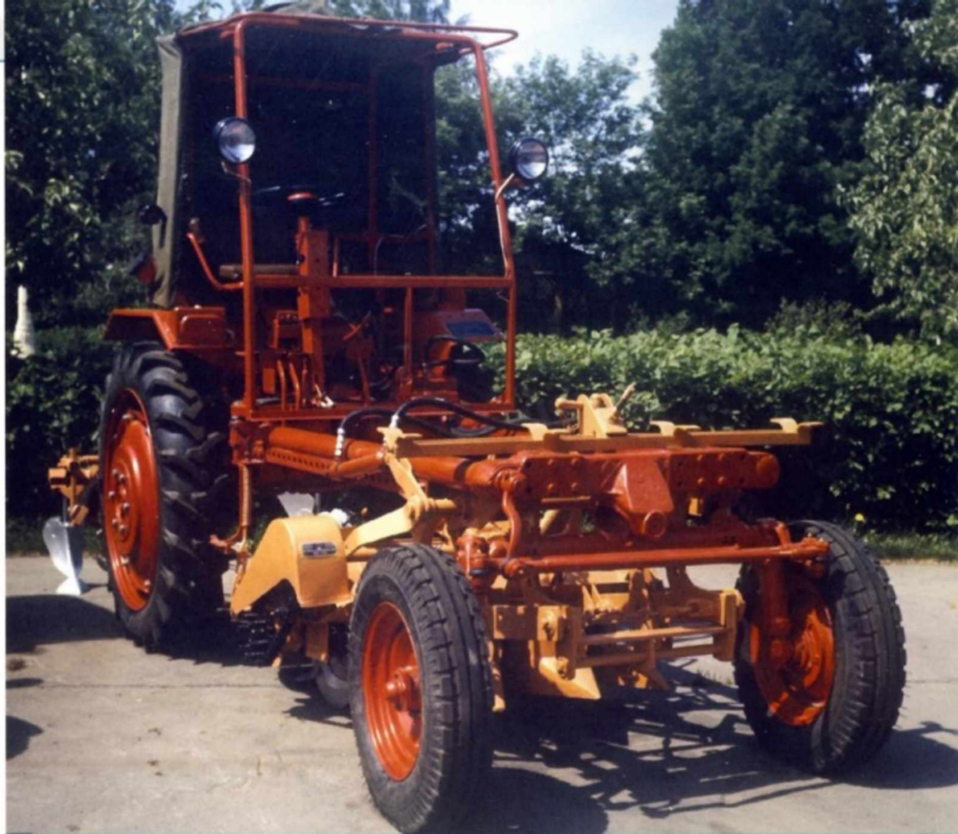
Самоходное шасси Т-16М, выпущенное Харьковским заводом тракторных самоходных шасси.

Кроме базового Т-16М, завод производил его специализированные модификации: Т-16ММЧ – для работы на чайных плантациях, Т-16МТ – низкоклиренсный, для работы в теплицах, Т-16МГ – с грузовой самосвальной платформой. Шасси Т-16М и его модификации предприятие выпускало вплоть до начала 1990-х годов.